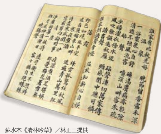
蘇水木《清林吟草》