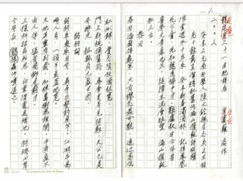
羅尚《戎庵二十一世紀詩存》手稿