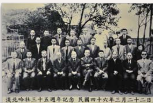
「淡北吟社三十五週年紀念」拍攝於1957年