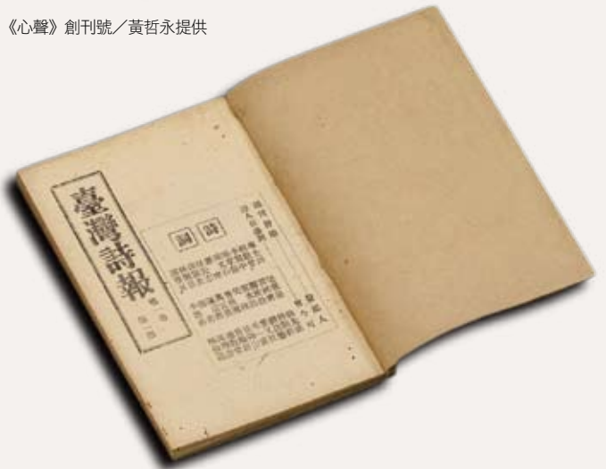
《臺灣詩報》第一卷第一期

師範學院國文學系必修科目表」與1948年的「修訂文學院中國文學系必修科目表」。當中規定大學文學院中文系和師範學院國文系的學生必須修習六學分的古典詩及習作課程。除此之外，與古典詩相關的課程，如詞選、曲選，也在必修課程裡佔有一席之地。甚而在「專書選讀」的項目中，古代古典詩著作亦是選項之一。