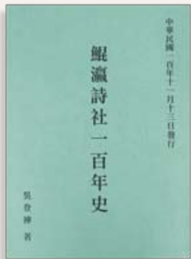
《鯤瀛詩社一百年史》