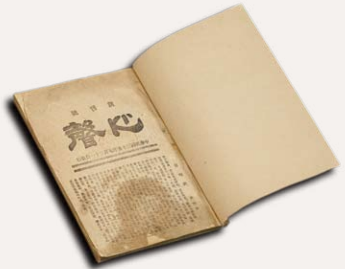
《心聲》創刊號／黃哲永提供

隨著國民政府來台的大專院校紛紛復課，造成了一個台灣史上首見的情況：第一次由官方學校將古典詩的閱讀與習作列入現代的制式課程中，使其成為每個中文系和國文系學生必須修習的知識。當中的關鍵，在於1946年公布的「修訂