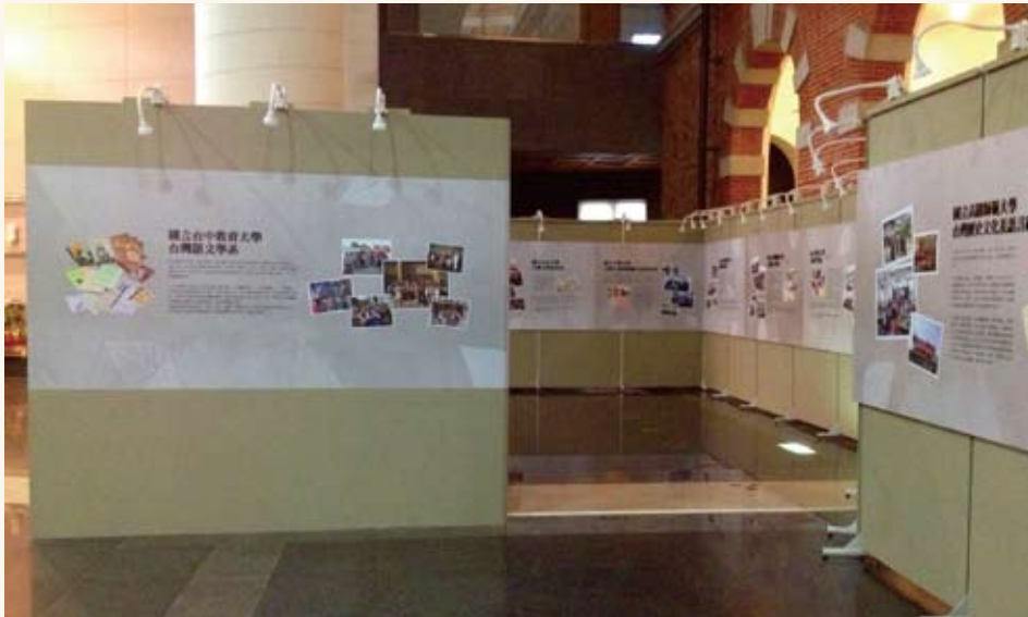
「台灣文學系所發展歷程」展示主軸以編年式呈現，介紹17個台灣文學系所。

大廳，為開放式空間，為能使空間使用和觀眾的流動性能被充分發揮，包括年表及各系所發展歷程的各個展板，都可獨立閱讀，以多向式的展場動線，讓觀眾自由洄游地進行參觀。