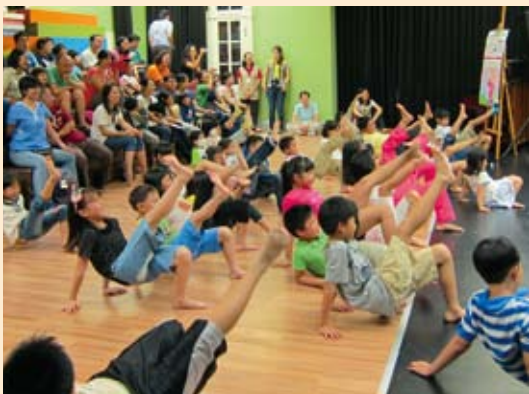
讓孩子透過遊戲、肢體開發啟發想像與創造力。

首先和台灣文學館自4月起跑的「兒童文學好好玩系列」結合，在文學體驗室推出4場「兒童劇場·文學跨界專題講座」。依孩童的年齡層發展，設計動態示範演出和靜態講座內容。邀請兒童劇場編導、演員、繪本作家、童謠創作者，帶領孩子體驗劇場做為綜合藝術，將文學、表演、繪畫、音樂、舞蹈等多種藝術集合而成為一種獨立的藝術呈現。