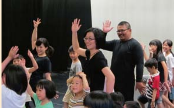
「好久好久以前·啾啾古說故事」孩童興奮地參與遊戲、扮演各種鳥類。

學的推廣。駐館計畫由以兒童為中心的「兒童劇場·文學跨界專題講座」做起始，未來還將舉辦文學劇場工作坊、《遇見秦得參》互動式劇場表演，以及經典文學劇場《一桿秤仔》的博物館演出活動。希望能藉由這些講座、工作坊、表演活動，讓各個年齡層的民眾對於文學閱讀、劇場表演產生興趣，因而能常到台灣文學館欣賞演出、在探索研究文學館豐富、珍貴、難得的第一手館藏同時，也能親身實作體驗表演藝術與文學之美，開拓文學戲劇的新視野。✎