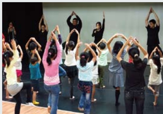
「懸絲偶的冒險旅程」以工作坊及示範演出的方式進行。

能同理兒童心理的故事：認同做決定不是件容易的事，人往往要從錯誤中才能學著長大。除了故事和影片分享外，也安排演員現場演出小野馬第一次和野狼相遇的橋段，並由演員近身操作劇中各式懸絲偶。最後，有5位自告奮勇的小朋友，即興發揮，透過聲音與情緒變化，化身為公馬、小狼、小白兔、母馬和野狼為腳色配音。這場示範演出，讓孩童透過工作坊與懸絲偶近距離相處，一探懸絲偶之所以栩栩如生的秘密，也開啟了孩子心扉的創意之光。