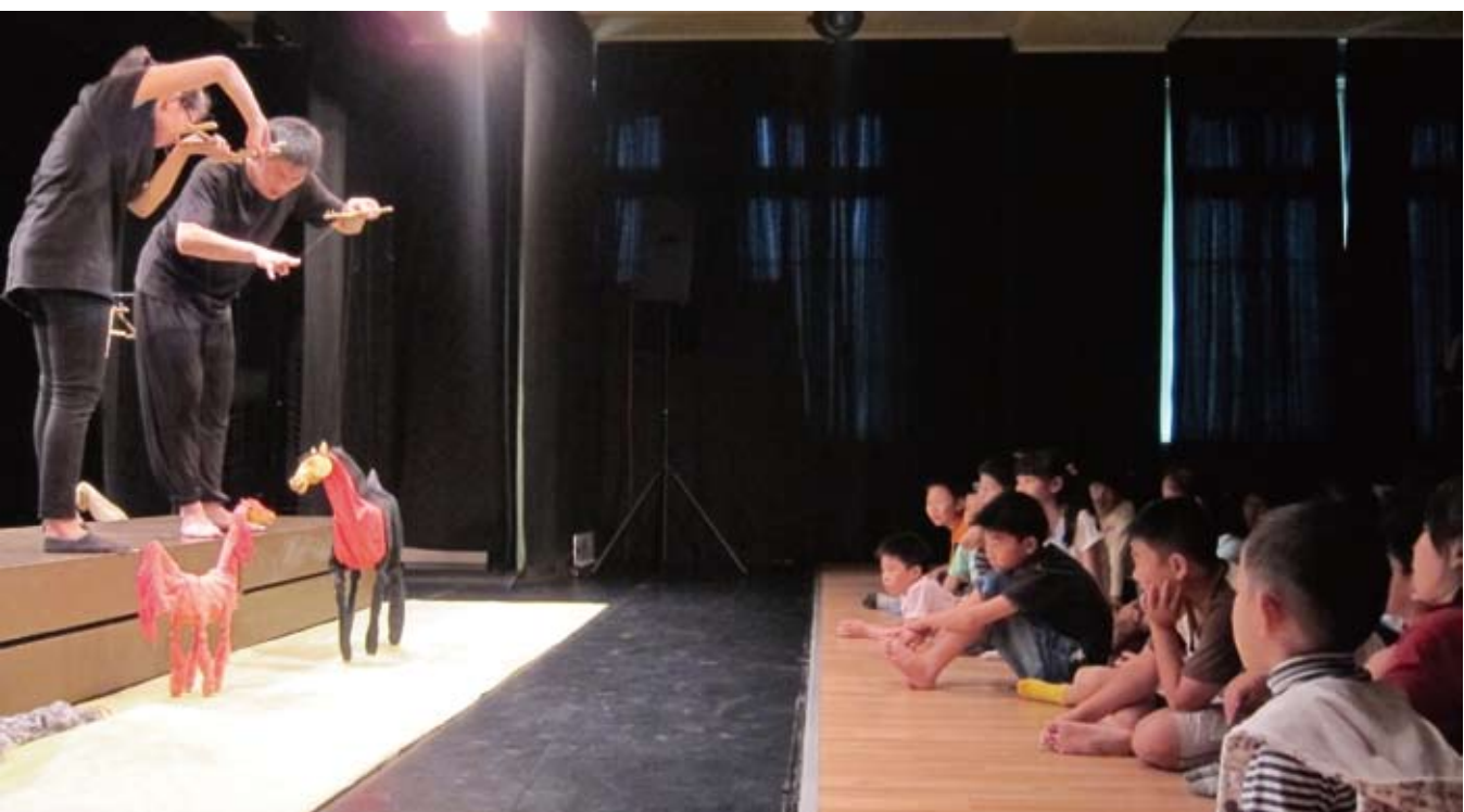
孩子們聚精會神地看著懸絲偶的示範。