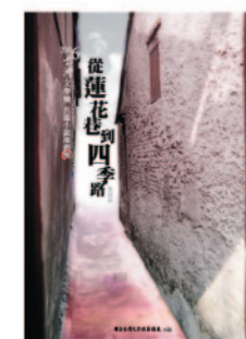
長篇小說推薦獎得獎作品集