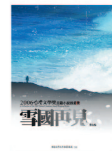
長篇小說推薦獎得獎作品集