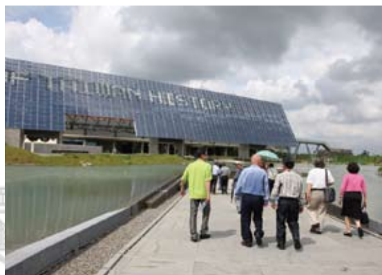
2012台灣詩歌節的活動，南北詩人會合後，下午第一站到位於安南區的國立臺灣歷史博物館參訪。

從唐山過台灣搭船過黑水溝開始，把當時的古船與蠟像人物呈現逼真的場景。400年前的台灣，原住民是這裡的主人，以平埔族最多，幾乎遍布台灣大部分平原；200年前的台灣，漢人移民冒險偷渡來台灣拓墾；之後，大量的漢人湧入台灣，那已是150年前；直到一百多年前因馬關條約割讓台灣澎湖給日本，日本殖民台灣。這些歷史上的各個時期，有的以照片圖示表現，有的以蠟像呈現。例如漢人與台灣原住民訂約租地，彷彿看見我們祖先最初的面貌；