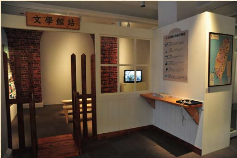
以「文學館站」車站情境復原營造出火車旅行的意象。

到作者騎乘摩托車上關子嶺：「山花隨處開紅白，野草迷離半綠黃。摩托車奔載清夢，臥聽人說入雲鄉。」，說出了二十世紀初葉古典詩與現代化並存的驚艷感。