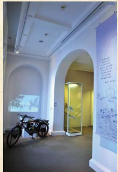
台灣早期機車搭配《南進台灣》影片展出，營造日本時代摩登的旅行氛圍。

代」、「日本時代」、「民國時代」三大區塊，共展出80餘件展品，呈現各時期旅人對於台灣的旅遊書寫，並分別以牛車、機車、汽車為各區展版的主視覺設計，透過各時期交通工具的演變，暗示著旅行書寫的轉變是與社會脈動息息相關的。