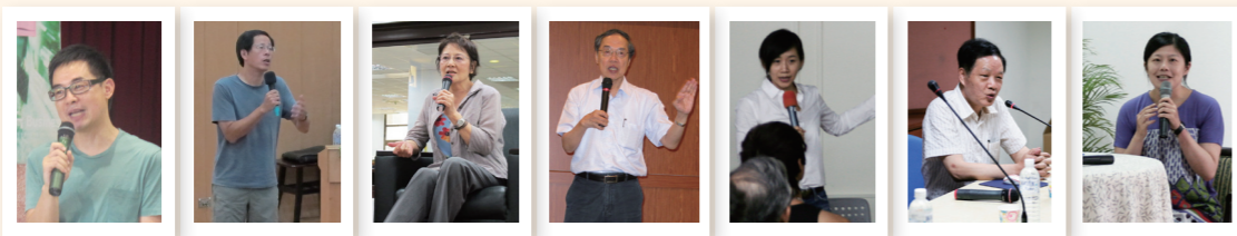
幾米 劉克襄 薇薇夫人 陳芳明 郝譽翔 向陽 劉梓潔