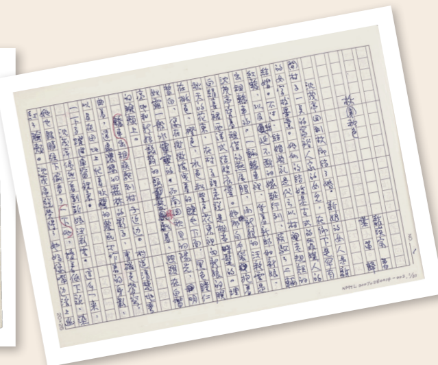
〈故園秋色〉譯文手稿