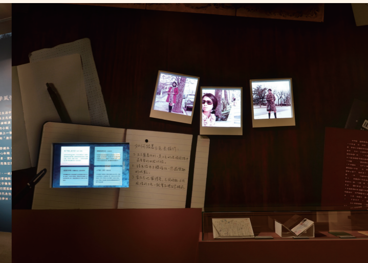
「三毛的流浪地圖」互動遊戲。在觸控式螢幕上以燈號呈現三毛行走的足跡，並輔以其各時期的照片。