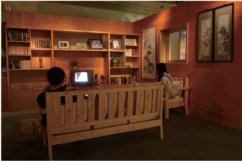
展場重現「三毛的家」，讓觀眾體會三毛長途跋涉的旅途後「回家」的感覺。