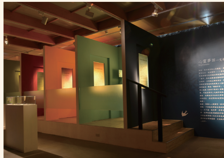
為了表現三毛各時期的創作特色，運用四間連接的小房間呈現心房靈魂序曲。