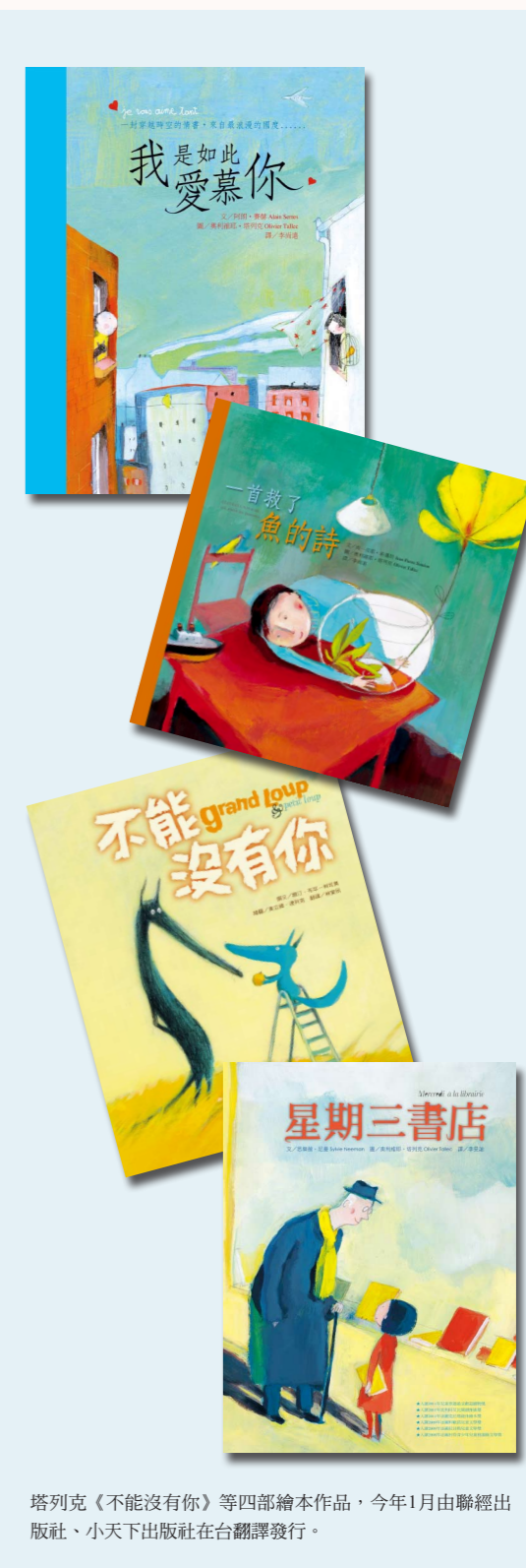
塔列克《不能沒有你》等四部繪本作品，今年1月由聯經出版社、小天下出版社在台翻譯發行。