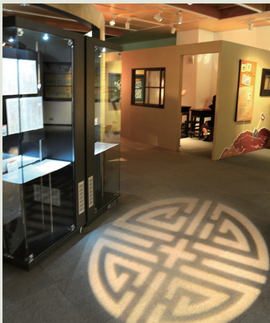
第3展區展出「台灣的兒女」系列手稿。

展場中也打造一座「望天丘」，讓觀眾可以模擬書中角色成為「今之古人」：拾級可瞭望《天鷹翱翔》中的模型飛機，俯瞰可見山丘形勢及恐龍星座所繪出的銀河。望天丘上2支飛碟悄然降落，拿到投射燈下，可接受到天罡星人的神秘文字，訴說「環保、知足、愛地球」。以紅葉紛紛呈現《紅葉》少棒隊的熱血故事，在本區結尾《台灣的兒女》手稿展示櫃前，運用復古的吉祥圖案投影，鋪