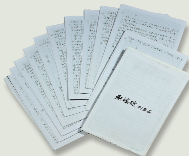
《魚藤號列車長》手稿。

李潼最後一部少年小說。2002年得知罹癌，一面與病魔奮戰，一面繼續書寫，直到最後生命旅途的最後一站。「誰是魚藤號的列車長？」成為絕問。三個族群：福佬、外省、客家人鮮明的個性，透過複雜的故事情節，動人的生命故事，將原本橫在彼此之間的距離，拉近。李潼重感情，在故事裡道出：「不見的人，失去音訊的人，才教我們懷念，才讓我們想起他種種的好嗎？」般的感嘆。