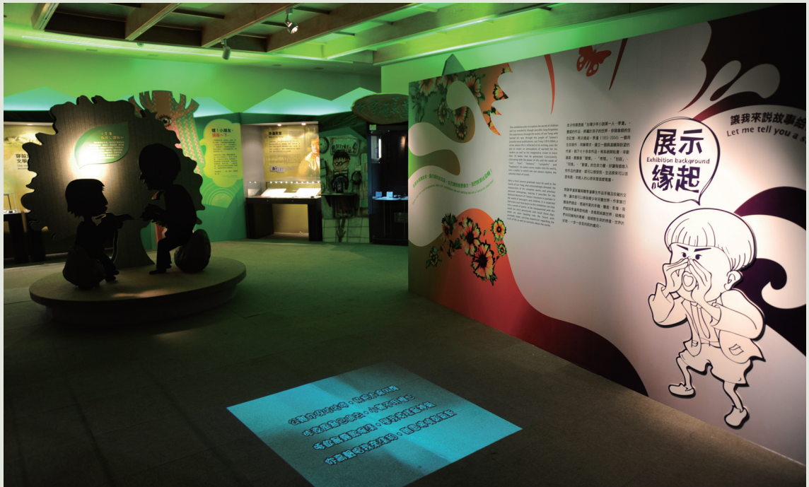
李潼展場以文學作品場景及李潼創作生命史兩條軸線並用，引導觀眾認識李潼作品主題與寫作形式。

《布都與我》獲得第15屆國家文藝獎；1987年、1988年以〈恭喜發財〉、〈屏東姑丈〉，獲得第10、11屆《中國時報》文學獎短篇小說評審獎及短篇小說獎。