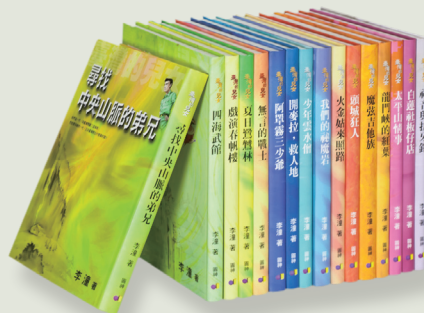
李潼的「台灣的兒女」系列作品。

這一系列歷史少年小說在兒童文學的領域中，具有關鍵的貢獻。主題以尋找「什麼人才叫台灣人」為開始。文學技巧豐富，李潼在勾勒這些人物時，運用巧妙的童話手法，讓主人翁身邊的事物變得很有趣，像是一個熱鬧的童話舞台，搬演著一個時代兒女的一生，敘說著憂心、關懷、抱負以及各樣的心情。這些，都在可愛的角色中，精彩的演出。此外其簡潔的語言娓娓敘說動人的故事，內容涵蓋族群及社會、時代脈流等議題。李潼希望孩子認真的了解自己腳踏的土地，感知、關心身旁周圍的生命，作一個快樂自由的台灣兒女。