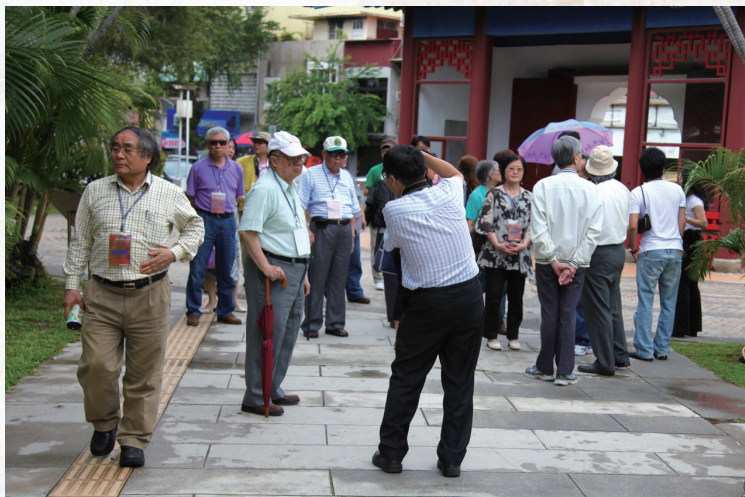
參觀延平郡王祠的詩人們仔細聆聽著解說員的導覽。