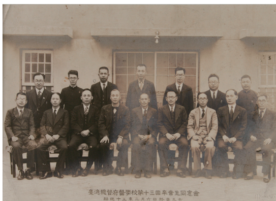
台灣總督府醫學校第十三回卒業生同學會留影紀念

做為傳統知識份子，他們的生命歷程，既曾面臨日治時期台灣殖民化與現代化之迎拒的矛盾，也