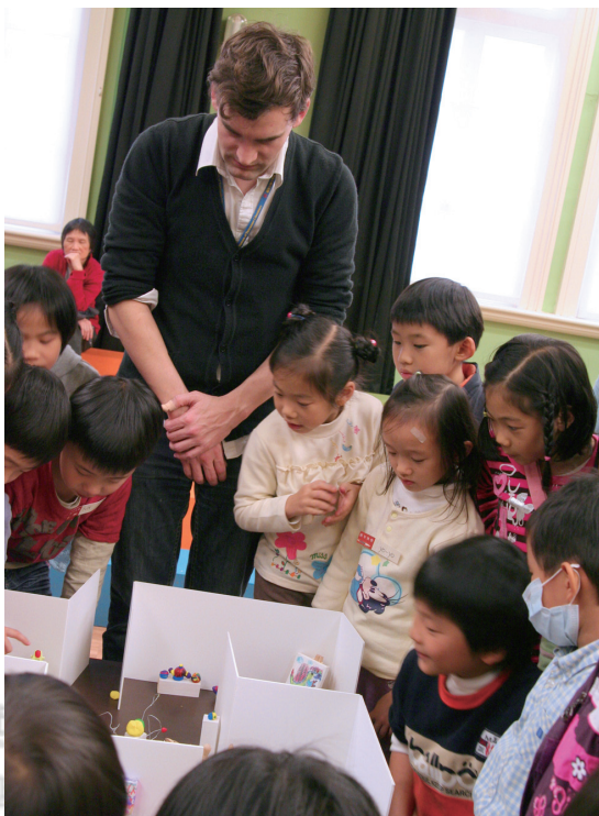
圍在這座「迷你博物館」前，小藝術家們的眼神中無不透露出滿滿的成就感。

杜科認為，與孩子的互動經驗是很非常要緊的，如同此次的兒童藝術創作課程，雖然安排有見