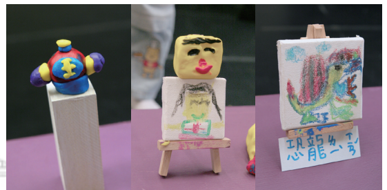
小學員們的繪畫及雕塑作品，透顯無限的創意與想像力。

術學院 (Nationale School of Decorative Art of Paris) 後，接觸設計、動畫、戲劇等各式媒介與形式，讓他可以將腦袋裡很多想法表現出來。畢業作品則以繪本創作《牽牛花屋的線索遊戲》呈現成果，後來還獲得薩巴甘出版社 (Sarbacane) 的青睞，於2006年發行出版。因此他也常常以自己的求學經歷鼓勵小朋友，雖然他小時候不是一個成績優秀的好學生，也曾被說握筆的方式「很怪異」，但卻很適合畫畫，在家人的鼓勵下持續作畫，才有今日的成就。