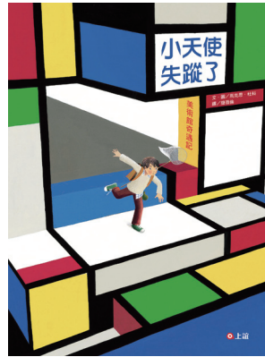
杜科第二本繪本《小天使失蹤了——美術館奇遇記》中文版今年1月在台翻譯發行。