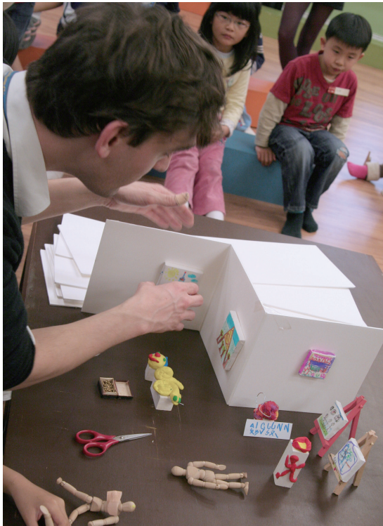
杜科不斷思索如何讓孩子將腦中的創意，在空間裡表現出來。