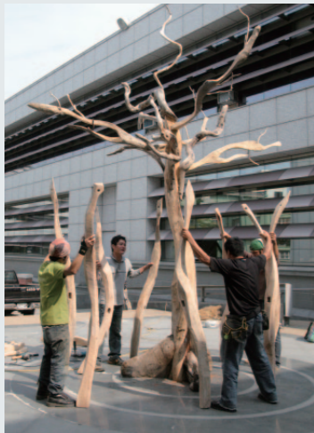
組裝過程不忘練習布農族的「八部合音」。