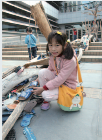
響應「鞋」助行動特展的小朋友。