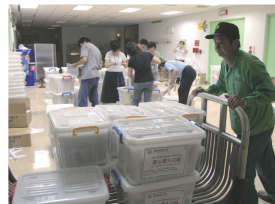
郵局人員協助台文館點交書箱準備寄送。