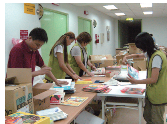
10月起學生志工亦加入愛心圖書的整理工作。

「一本一本的書，代表的，是對香林孩子們學習的企望；一份一份用心傳達的愛心，更是給了香林孩子們最深的感動……。在整理的過程中，我們在海拔2200公尺的雲端，感受到來自臺灣文學館最大的愛與關懷。」9月15日，自海拔2200公尺高的嘉義縣阿里山鄉香林國小捎來一封信，對於國立台灣文學館捐贈14大箱的書籍、文具，表達感謝之