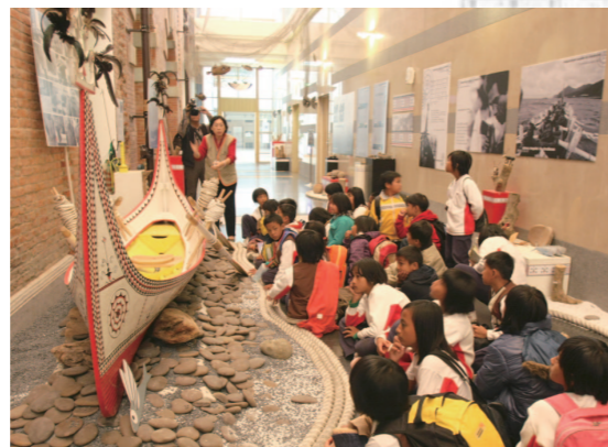
與遠東集團合辦「大手牽小手 府城一日遊」活動，高雄縣桃源鄉四所國小來館參觀。