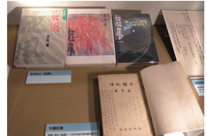
展場內展出各時期的《旋風》與最早版本的《今構机傳》，以及各件珍貴的第一手史料。

蕭白先生的文學創作，自成一格，體裁雖以散文為主，亦揉合小說與詩的況味，富有哲理與禪思，並能與其生命情調相符。雖然身處在反共國策當道的時代，仍努力經營一方文學風景，一如他晚年寄情山水書畫，都是在濁世裡保持一片心靈／文學的淨地。