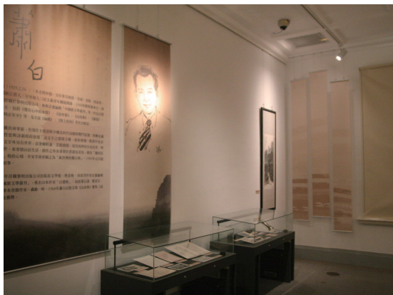
展場陳列蕭白手稿、書信、器物及水墨畫等多項珍貴文物。

因坊間有同名書，改稱此名，以「春雨樓」名義自費出版僅500本，分贈文學前輩及愛好者，也因此得到胡適、高陽等人的肯定與推崇。這部小說以中國山東「方鎮」與各式角色的興衰，藉由家族的興衰具體而微地描寫共產主義在中國興起的原因，被胡適、夏志清等評論家視為「反共文學」的經典作品，更入選1999年「台灣文學經典」小說類書單。本次也展出姜貴與多位文友的通信，信中可見各界對翻譯、介紹姜貴小說的努力，是十分珍貴難得的第一手資料。