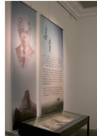
以姜貴素描畫像為背景的展場一隅。

姜貴與蕭白先生都是西元1949年前後，隨國民黨政府來台的作家，兩人雖未有交往，卻有著許多大時代下的歷史巧合之處。兩人皆出身軍旅，卻能在兵荒馬亂之中走上文學寫作的道路。對於兩人的文學創作，學術界其實討論得不多，較為集中被討論的主要是姜貴的「反共小說代表作」——《旋風》。除此之外，余等生也晚，對於二位文壇前輩豐碩而精彩的筆耕花園，其實是懷著崇敬但陌生的心情來看待。姜貴一生共寫作出版二十餘部作品，以小說為主，主題時代貫穿民國前後一百餘年，除卻反共戰鬥的題材外，更有大量以晚清、軍閥割據及其來台後生活種種為背景的小說，對照姜貴先生一生顛沛流離的經歷，更顯其文學成就的可貴。