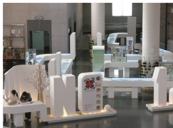
充滿現代感的白色展櫃，宛如高高低低的白色積木，座落在國立台灣文學館藝文大廳，與古典建築的紅磚相映成趣。

本主題展的雜誌創刊號共三百七十多種，除本館自身徵集多年的館藏成果外，亦有為此展出苦心蒐羅的借展品，展覽規劃依「知識發聲・思想行動——人文思想類」、「民主言論・社會關