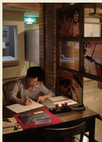
文建會黃碧端主委在日本神奈川近代文學館「台灣文學館的魅力」展場留影。(2008. 8. 2)