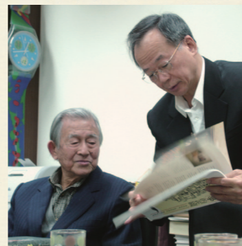
陳千武先生(左)來館參訪。(2008. 2. 16)