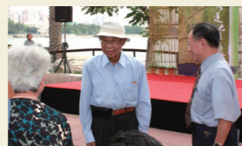
高雄文學步道開幕與錦連先生(中)合照。(2009. 5. 31)