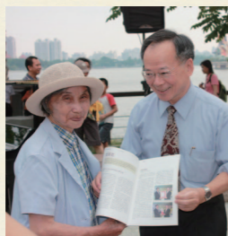
高雄文學步道開幕與葉石濤夫人(左)合照。(2009. 5. 31)