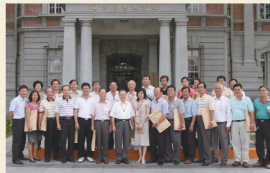
文學館敞開大門，與台南市里長有約廣納建言。(2008. 6. 24)