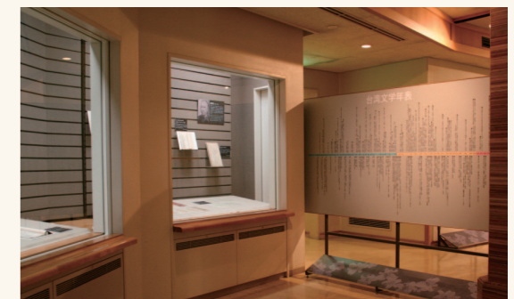
展場中呈現台灣文學的年表。

展示及教育推廣作為公共服務的機能，以提供民眾更多元的文化內涵，並帶動文化發展。這是國立台灣文學館作為文學重鎮的基本精神及終極關懷。