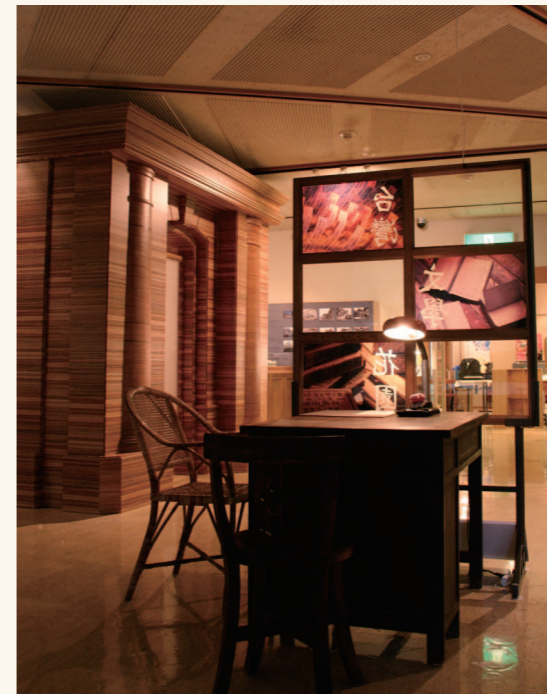
展場中重現台灣作家的文學書房場景。

國立台灣文學館為台灣文學研究之重要機構，2003年10月17日正式開館，完成各項開館主題展示區佈展，充實展場設備與閱覽室、藝文大廳等各項內部軟硬體設備。自籌備時期即是所謂的文化資產保存研究中心時期便陸續進行台灣文學各項研究，亦同時進行台灣文學相關影音計畫。為推動多元樣貌之台灣文學研究領域與發展視角、分享文學蒐藏與研究資源，台灣文學館備有近中長程計畫，以提供台灣文學界，更具深度與廣度的研究成果。為呈現台灣文學的豐富性及多樣貌，更以研究及典藏作為向下紮根的基礎，