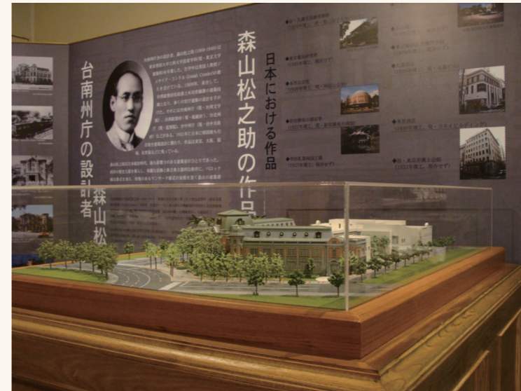
台灣文學館建築創建於1916年，屬西洋歷史式樣，為當時官制建築之典範。

在這當中不難發現台灣文學的質地，是如何受政治社會環境的變化所牽引，而這當中的文學家，更是跨越種族及語言，在文學的場域中，互相奧援。這一部份的主題，我們以館藏文物為主，從林獻堂及梁啟超的書信往來談起，日台文學家共同組成的文藝團體及同人誌，一直到吳錦發、瓦歷斯·諾幹等原住民議題的作品，由此文物拓展出台灣文學史的意涵，嘗試從展出的文物中，展現台灣文學史的深度與廣度。同時亦介紹台灣文學作家，在面對詮釋代表性與否的疑慮時，我們寧可將焦點放在不同氛圍下台灣所產生的作家風