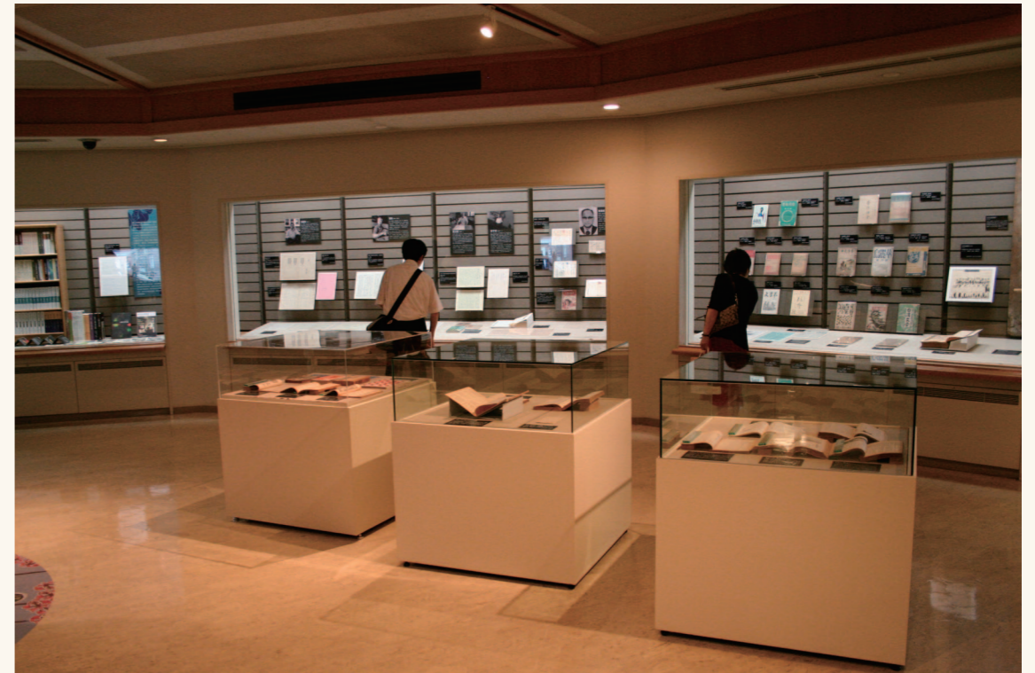
「文學的花園」展區陳列超過80件文學創作手稿、書信、圖書等重要文物。

豐厚文學的閱讀人口，更與學校、社區及企業結合成為文藝網絡，辦理各項文學相關座談與讀書會。本館藉以活潑多元的展示及教育推廣活動帶動文學閱讀、創作與文藝復興之風氣，深入民間；並透過國際文學展覽，促進文化交流，提升台灣文學之能見度；充實館舍建築設備，健全組織與強化服務功能，創造多元文化展演空間，培育台灣本土文學與人才。其次，繼續充實本館文學史料及文物，整合國內外學術機構，推動台灣文學研究專題，形成台灣文學史料及研究成果的彙整重鎮，提升藏品在展示教育、推廣活動以及