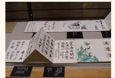
吳新榮與文人往來簽名題詩紀錄簿本。