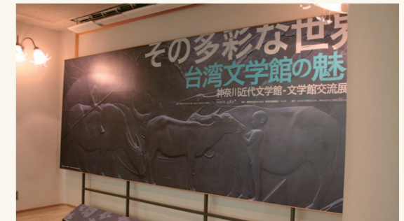
強調與土地連結的展場入口意象。