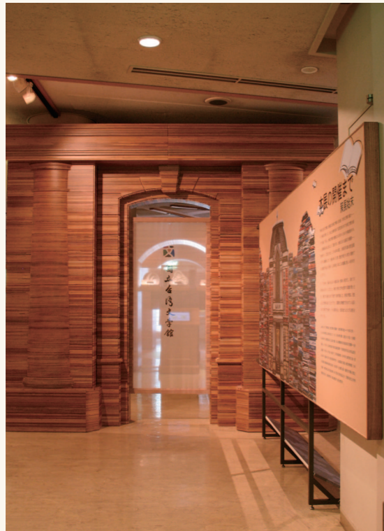
展覽入口區之大型木作。