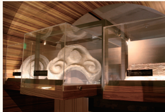
第一展區「遇見台南州廳」中展出台文館建築元件。