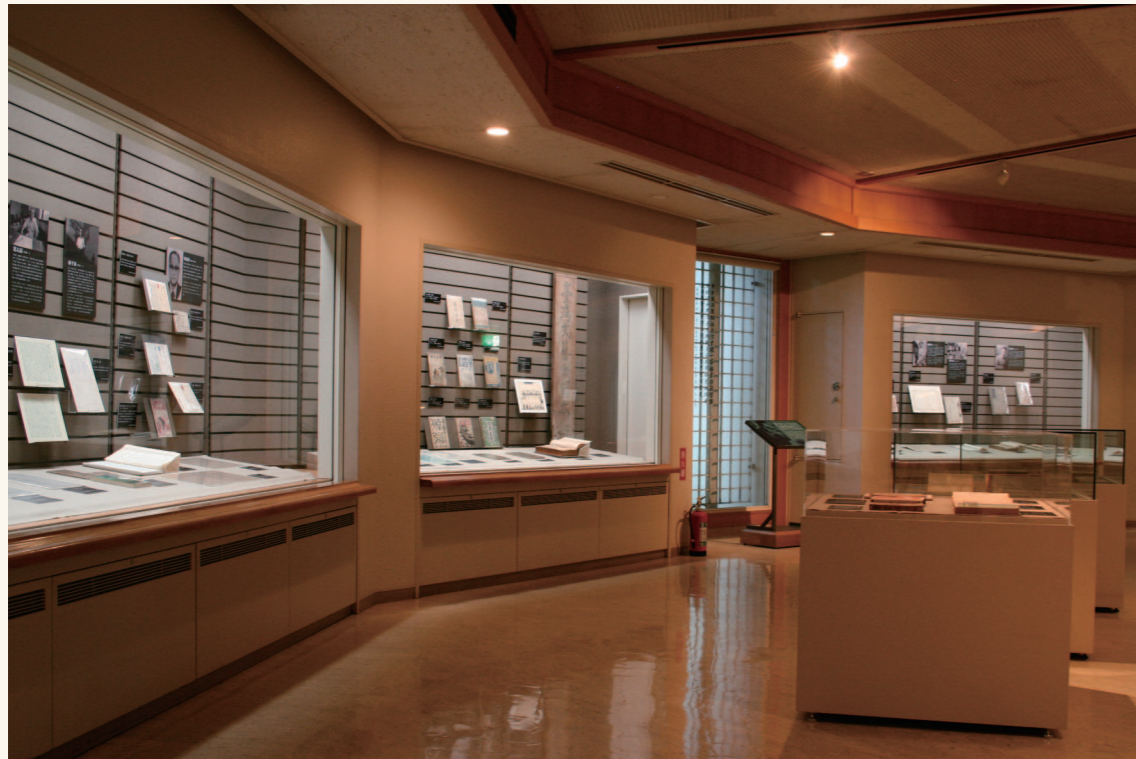
「文學的花園」展區主題以台灣文學館館藏文物為主，嘗試從文物中展現台灣文學史的深度與廣度。

此次特展從第一個主題「遇見台南州廳」開始，國立台灣文學館的建築原為日治時期的台南州廳，創建於1916年，屬西洋歷史式樣，為當時官制建築之典範。我們以建築的生命來作歷史的鏈結，舊建築的設計，是文學館經過古蹟再造後勃興的新生命展現。2003年正式開館，參訪人數從千到萬，如今累積了一年近20萬的人潮。