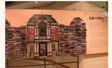
展覽入口處以抽象的書牆呈現文學的豐富性。