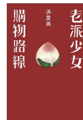
《老派少女購物路線》 洪愛珠 | 著 遠流 | 出版