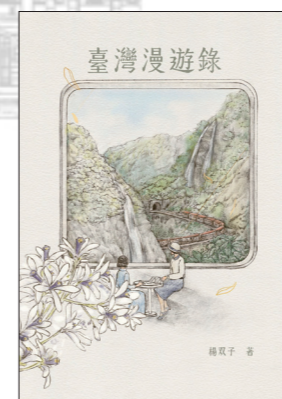
《臺灣漫遊錄》 楊双子 | 著 春山 | 出版