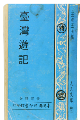
《臺灣遊記》 黃得時 | 著 臺灣商務印書館 | 出版

從凝視風景、在移動中丈量地方、以嗅覺與味覺重現記憶，臺灣作家巧妙運用了五官書寫，使臺灣風景呈現出多層次的文化意象，也展現出文學再現地方經驗的多種可能。