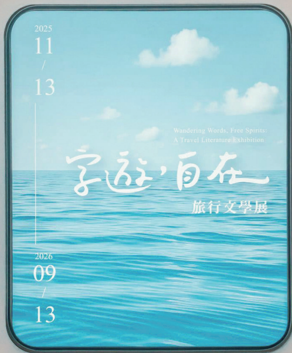
「字遊，自在：旅行文學展」展場入口以海洋、天空、窗戶的圖像，營造輕盈的氛圍。