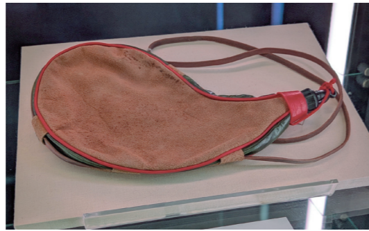
三毛收藏的皮質水壺具有鮮明的異國情調。

也別忘了臺文館重要古物的「徒步旅行名人題字錄」，那是張深切在1924年的徒步旅行紀錄，沿途蒐集的不只是名人題字，更是張深切以行動串連臺灣文化界的一次努力軌跡；而王浩一的小鎮漫步筆記，讓我們懷念起在行腳節目《浩克慢遊》中他那瀟灑不失童趣的身影。