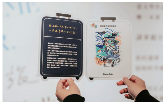
版畫般的套印印章充滿紀念價值。