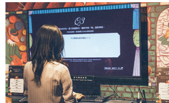
「來自時空旅人的明信片」互動裝置以文學作品為基底，每個人可根據當下心情輸入文字，並獲得AI生成的獨一無二明信片。

當然，也有屬於自己的旅行印記，展覽DM化身足跡收集冊，展場中的四層套疊印章，層層覆蓋出旅行文學中的專屬印象，是參觀後的最佳紀念品。