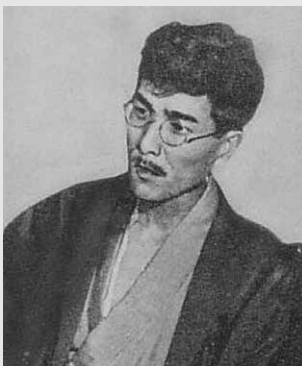
山川均，引自維基百科同名條目

何管制。臺灣很少有右派，大概都是左派的無政府主義。另一種很少人注意的左派是蔣渭水這一派，很多人說他是民族派，其實仔細分析他的立場是晚期孫中山的聯俄容共、團結工農這套，背後受列寧的影響很深，與同樣是民眾黨的蔡培火完全不同，蔡培火等人後來退黨成立地方自治聯盟，跟這個也有關係。所以根據流派，大體上日本時代有共產主義、非共馬克思主義、無政府主義、左派的民族主義這幾種。