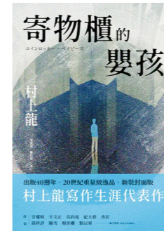
《寄物櫃的嬰孩》 村上龍 | 著 張致斌、鄭衍偉 | 譯 大田 | 出版 (2011)