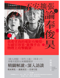
《不安擴張：論奉俊昊》 田鍾瑀 (Joseph Jonghyun Jeon) | 著 于昌民 | 譯 積木 | 出版 (2025)