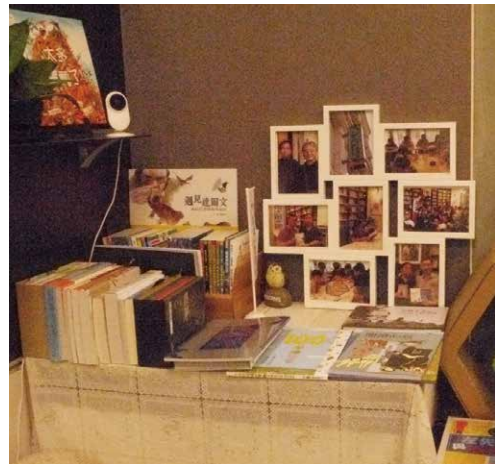
左／書店保留了特色，只介紹青少年文學讀物。 右／當作品印成鉛字，小朋友比誰都快樂。