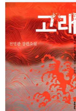
고래 千明官 (천명관) | 著 문학동네 | 出版 (2014)