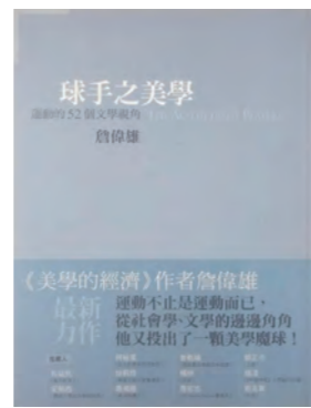
《球手之美學——運動的52個文學視角》 詹偉雄·著 遠流出版，2006年11月

楊照卸下評論者的外殼，換上球迷的身分，以球迷的眼睛捕捉運動場與當下社會文化之間的連結。賽場上的萬化千變與運動員的執著汗水，正是射進楊照骨子裡的鄉愁。在熱鬧掌聲中發覺缺漏，挫敗反思中看見希望，在自我的運動記憶及球迷記憶之間，以一種親密且保有批判的形式找出橋梁。1999年、2000年，楊照分別在新新聞文化出版《悲歡球場》、《場邊楊照》兩本運動散文評論，觀察描繪自NBA籃球球星談至日本職棒野茂英雄，亦有針對臺灣職棒在1990年代末期所面臨的種種困境與挑戰。球場如人生，《悲歡球場》記錄了90年代末運動文化、運動明星的變化，以運動文學角度而言，可視為重要的史料文獻。