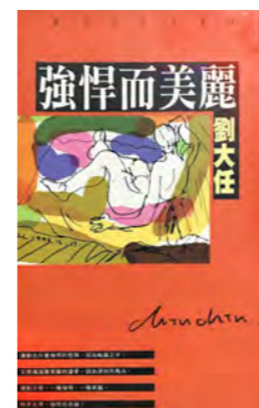
《強悍而美麗》 劉大任·著 麥田出版，1995 年 1 月

運動者有如化身為追尋聖杯的騎士，在揮灑汗水的歷程裡，尋找運動對自我生命的深層意義；而鬆開鞋帶的我們，在觀賽之外，藉由文字這把鑰匙，體驗那些「追尋聖杯」的技藝與記憶。以下 10 本作品，正是引領我們走出曠野、抵達美麗月灣的 10 把索引。