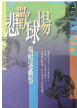
《悲歡球場》 楊照·著 新新聞文化出版，1999年8月