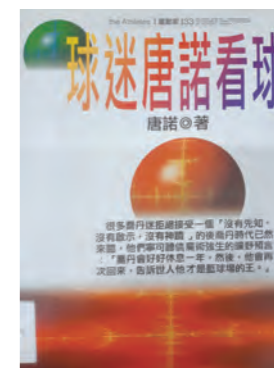
《球迷唐諾看球》 唐諾·著 麥田出版，1994 年 10 月

1995 年劉大任出版《強悍而美麗》後便多了一個新的身分：運動文學作家。他曾自述：「某年初春在德國杜蒙乒乓球世界錦標賽，因觀看江嘉良苦練反手攻球而始終沒有突破的痛苦面容，不斷浮現在眼前而寢不能寐，遂披衣而起，摸黑在小餐廳伏案到天明，即為本書緣起。」在本書中，劉大任發揮其深刻的人文關懷與思考，筆觸廣袤深厚而扎實，出入古典與現代之間，對於運動的視角看得精、看得準、看得遠，是令運動脫離通俗報導的指標作家。唐諾曾如此評價：「他的運動文章之所以異於常人，來自運動之外有力的支撐，包括精純的意志，人文的訓練，文學家的底子，和對生命對死亡昂然不回的數十年如一日的姿態。」本書以籃球、網球、桌球為主軸，釣魚、棒球、美式足球、狩獵等為題材，將運動意象轉構成文化意涵，是在臺灣運動文學中深具開拓性的一部作品。