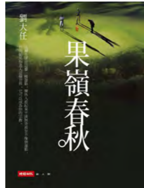
《果嶺春秋》 劉大任·著 時報文化出版，2007年8月