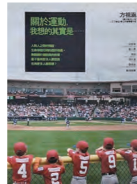
《關於運動，我想的其實是……》 方祖涵·著 遠流出版，2015年6月

劉克襄在本書的序中提及：「劉大任的運動文學《強悍而美麗》帶來一個難以攀越的視野。那本書像高掛籃球場的NBA球衣般，擁有運動文學的榮崇地位，後繼者很難再超越。詹仔這一系列的書寫，在結集時所展現的成績，似乎毫不困難地，就接近了這個高度。」本書於2006年出版，集結作者詹偉雄自《中國時報》人間副刊「三少四壯」撰寫的專欄文章。自幼著迷於運動的他，不論是棒球、籃球、網球、足球、高爾夫球等皆有所涉獵，經由他具社會學的觀照與剖析，結合文學的敏銳觀察，分析「職業運動員」的階級與倫理議題，就像站在投手丘上的投手，他的文字便是各種球路，變幻莫測、難以捉摸，刻劃出唯他獨有的運動美學。