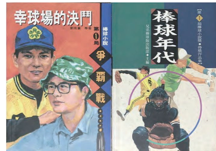
《幸球場的決鬥》、《棒球年代》。