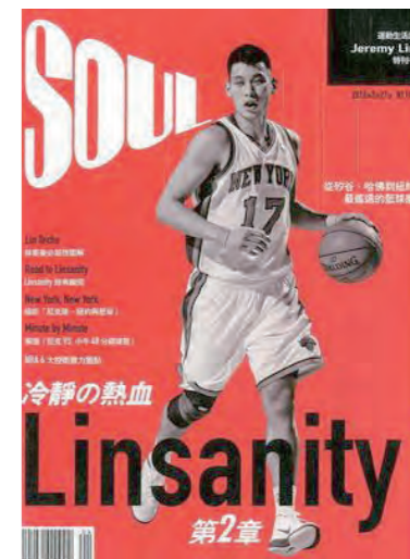
以林書豪為封面的體育雜誌《SOUL》。

《SOUL》於2012年3月發行以「林書豪」為專題的特刊號，也可視為「試刊號」；4月發行第1期，之後每月一期，12月發行第8期《跑步與生活專刊》後即停刊。總計留下九期。主編者李赫(恰巧與另一位小說