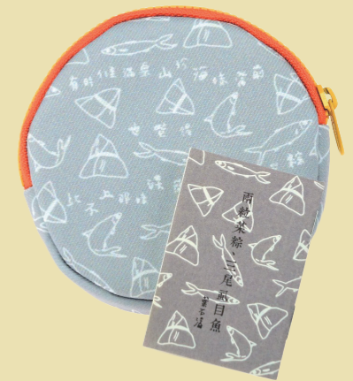
臺文館以〈兩粒菜粽，三尾虱目魚〉為發想，推出零錢包文創商品。

對於飲食記憶的詮釋不僅限於食物本身，飲食的場所、氛圍、共食的人們，以及食用當下的背景、環境等，也都曾一同形塑記憶的細節。二戰於1945年結束，葉石濤在時隔將近半世紀後，仍能生動香甜地描寫當時的菜粽滋味，源自於在戰爭時期的物資匱乏以及過往與阿玉的主僕情誼。手稿中的修改很少，也看得出葉石濤對這段回憶的重視，使得文句流暢自然。