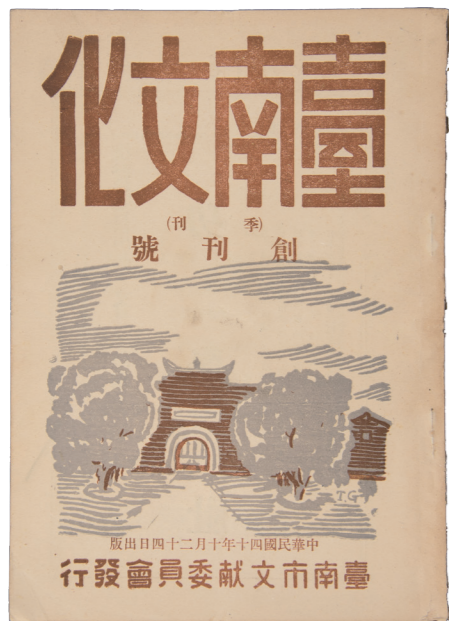
《臺南文化》創刊號封面，顏水龍繪「延平郡王祠」。

「要害一個人，就勸他去搞出版」、「要害一個人，就勸他去辦雜誌」。在今天聽起來，這兩句話是說因為現代人少閱讀，辦雜誌傾盡心力又耗費不貲。而在更早，則是指戒嚴時期，在言論和出版管控之下，辦雜誌可能丟掉性命。無論哪一個時代，辦雜誌、編刊物都不是一件簡單的事情。