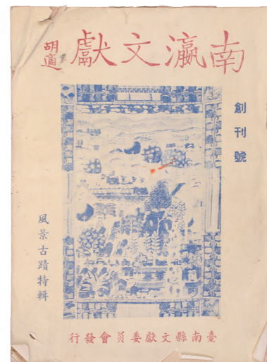
《南瀛文獻》創刊號封面，6位日本工程師繪製的嘉南大圳圖。

這些人之一，是被稱為「文史活字典」的石暘睢（1898-1964）。出身望族之後，鍾情於文史的他，在日本時代便四處採集文獻文物、從事調查活動，並擔任「臺南州臺南市歷史館」的館長。第二次世界大戰甫一結束，他就從疏開的鄉間回到館內整理，甚至有長達一年多的時間住在裡面，確保珍貴的歷史文物不被竊。