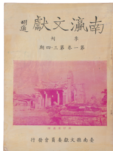
3 | 4 3《南瀛文獻》1卷3、4期。 4《南瀛文獻》1卷2期。

但隨著發刊期數增加，著眼於「地方」的內容逐漸躍為要角。3卷3期「安平特輯」、3卷4期「西區特輯」，規劃了特定地區的民俗、產業、文物介紹。4卷2期「文物專刊」、4卷4期「歷史館專號」則以圖文並茂的方式，介紹臺南市所藏的文物史料，希望「提高市民對鄉土文化的認識」 ④ ，兩期專號在出版後不久，內容更擴大為「南嘉雲地區歷史文物展覽會」，研究者謝仕淵認為，《臺南文化》雖有與時局相應的口號，但其立場卻是以地方歷史文化為核心。 ⑤ 參與製作歷史刊物、撰寫歷史的人，也不僅僅是刊物背後的編輯委員而已。翻開《臺南文化》創刊號，可以看見每隔幾頁就有大小不一的廣告版面：「批發體育用品·文具·印刷 功學社」、「洋餅麵包高級糖菓 製造批發零售 天香齋餅舖」，且廣告商種類多元，舉凡戲院、合作社、銀行皆有。這是由於發行之初，市府並無經費可供開支，文獻會委員都是無償性質，亦無稿酬，為了順利出版，由當時的委員對外招募贊助商，共計 35 頁的廣告