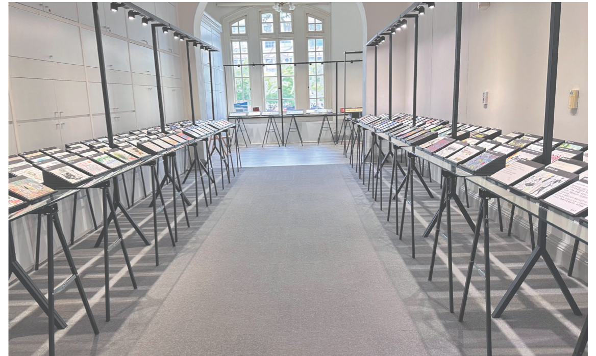
來自海外的明信片，透過文字書寫、油畫、素描、水彩、攝影、剪貼、雕刻、刺繡等不同方式創作，表達對臺南的祝福。

時序進入五月，街道上的鳳凰花已悄悄綻放，盛開的橘紅色花瓣，與翠綠色的樹葉彼此映照，這是屬於臺南的風景。自邁入 2024 年，各種有關「臺南 400」的展演活動先後盛大登場，只因 2024 對所有臺南人、對古都臺南這個城市來說，是具有歷史意義的一年。年初的臺灣燈會也特別選址在臺南舉辦，並由許多知名歌仔戲主角演出《1624》大型歌仔音樂劇，喚起人們想像關於 1624 那年臺南與世界文明的交會時光。