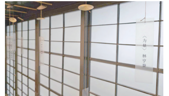
4 | 5 4「六十而笠：笠詩社六十周年特展」在全臺共有 4 個展場、14 場活動，並於臺文基地舉辦開幕儀式。 5 臺文基地齊東舍茶之間展場一隅掛有作家詩句。

也有檔案格式和硬碟壞掉的問題。對此，李玉芳傾向紙本甚於電子——「因為我們都有年紀了，眼科醫師也都贊成看紙本。」