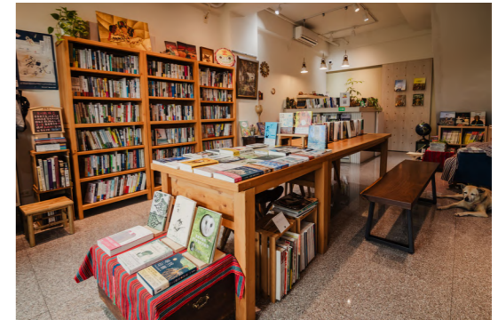
種子書屋店內空間較小，但選書多元豐富。