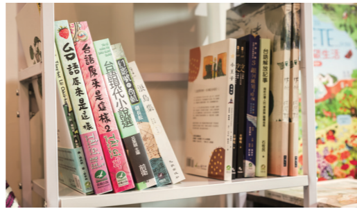
1 | 2 1 種子書屋的鎮店之畫，畫面中有一雙手頂住山脈，是莫拉克颱風受創兒童所創作之藝術治療作品。 2 店內推廣台語閱讀，特別設置一處「台語冊」小書櫃。

對此她感到非常震驚，她坦言：「我其實知道台語式微，可是我不知道這麼快，這麼嚴重。」因此，種子書店開始推廣母語，今年戴金蜜已辦了2場台語講座。其中一場邀請到臺中教育大學臺灣語文學系方耀乾教授，除了分享台語詩外，也說明如何協助政府制定國家語言發展法。另外一場則邀請一位完全以台語跟她3位小孩溝通的媽媽，分享生活中完全使用台語是否會造成任何困擾及如何解決，提供其他想以母語與小孩溝通的父母親參考。同時在書店也特地增設一個「台語冊」，讓讀者多接觸台語書。