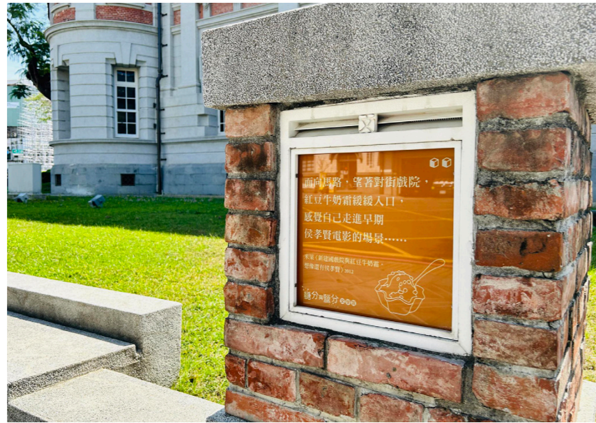
有著「半糖」滋味的甜品令人難忘。摘自米果〈新建國戲院與紅豆牛奶霜，想像還有侯孝賢〉。