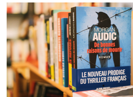
店內選書以法語繪本、童書、文學作品或是人文社會科學領域的書籍為主。