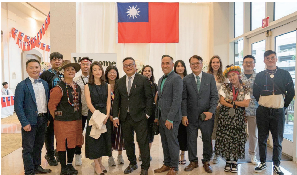
臺文館、臺東大學全體參訪團隊於開幕式後合影。