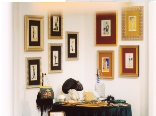
訪談當下，舊香居藝空間正在展出「時尚服裝畫的黃金時期」，牆上掛著一幀幀 20 世紀之交、巴黎高級訂製服設計師的版畫作品。

現在龍泉店大半空間用來擺賣線裝書和古籍珍本，羅斯福路巷子內的臺大店賣一般的文史哲書；師大路巷子內還有另外一個空間，專門辦藝文展覽，就是希望創造更多分享和交流。浩宇說，他們會製作精美的展刊，每一檔展覽最長要花上六個月籌備。