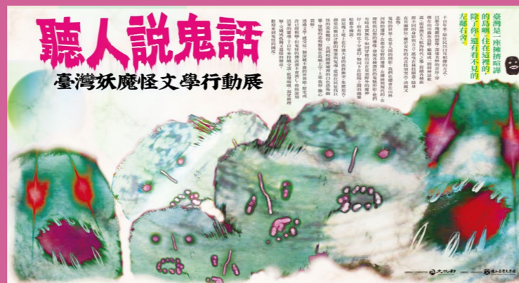
「聽人說鬼話——臺灣妖魔怪文學行動展」主視覺。

說到「鬼故事」，就算是那個最不爱講話的人，到最後，也會開口講個兩句。各樣的鄉談傳奇充斥時空之中，我們呼吸的空氣中總帶著一絲詭譎，有的故事驚世駭俗，有的故事富含寓意。這些「鬼故事」從哪裡來？又會到哪裡去？我們談論的，究竟是真實？還是幻想？虛構亦或非虛構？且聽說書人娓娓道來。