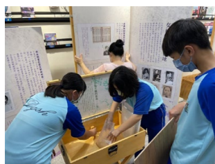
東港高中師生協力佈置文學行動展。

有人的地方，就有鬼怪傳說。人們對於鬼怪深感恐懼，卻又津津樂道。臺灣的民間故事如虎姑婆，在世界各地都可以找得到相同元素的文本，例如歐洲的「小紅帽」或「糖果屋」等，代表人們都有著對於未知世界共同的想像或經驗。臺灣在解嚴之後，大眾傳媒百花齊放，各種鬼怪靈異創作也隨之興起。司馬中原擅長講述中國北方的鄉野奇談，並雜揉了各地的民俗傳說，創作出了許多膾炙人口的恐怖故事。街談巷議的鬼故事在 90 年代後成為大眾文學的熱門創作主題，臺灣各地如軍隊、醫院、校園乃至各地皆有的廢墟，都出現了大量的靈異傳說。藝人陳為民出版許多關於軍中鬼故事的創作，電視節目《玫瑰之夜》的「鬼話連篇」單元，成為 90 年代靈異節目的濫觴。