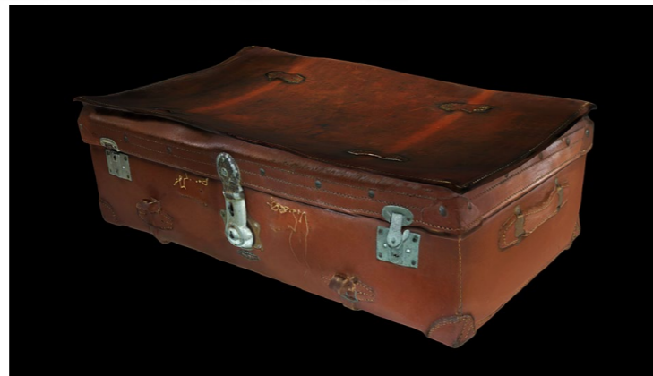
皮箱 3D 掃描呈現。