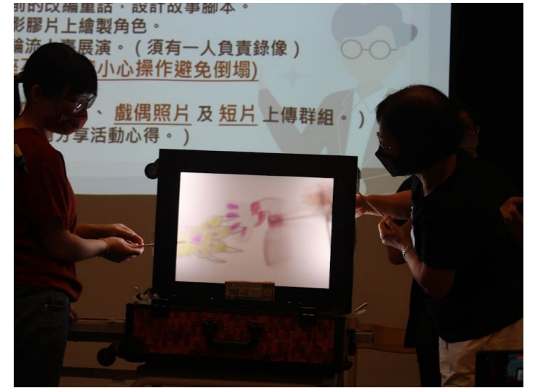
學員自製戲偶、自創劇本，上台操作資源箱皮影戲道具。

「倘若你不方便來找我，那我就親自到你面前來。」臺文館自 2018 年起為實踐文化平權與近用權，以臺灣文學為主體陸續開發了兒少、聽障、視障、失智與創齡等 5 款文學資源箱，期待用輕巧便攜、機動靈活的方式，將觸角延伸至全臺各地，將臺灣文學體驗帶到民眾跟前。這樣貼近多元族群的「移動式微型臺文館」，迄今已上山下海深入城鄉，累積開辦過上百場活動。