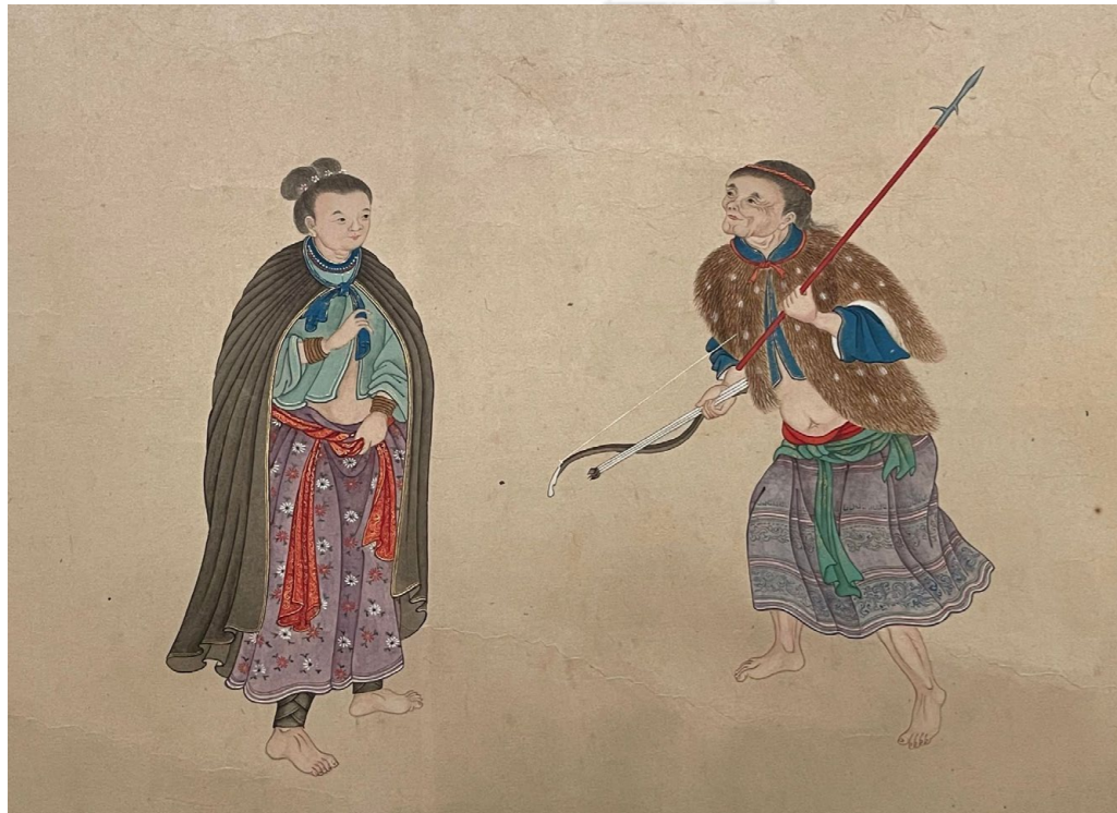
清謝遂《職貢圖卷》（局部）中的部分臺灣原住民族樣貌（國立故宮博物院藏）。

根據姨婆和耆老的說法，排灣族的男女服飾均有披肩，男子的比較簡單，是一塊長方形的布，其中對稱的二側會有流蘇繩，布則是繞過一側手臂下方，僅單邊綁在肩膀上。至於女子的披肩就比較複雜了，長度大約到胸前，平放時看是一塊圓形的布，中間有洞孔是為脖子位置，布上會依據身分地位而有不同的圖騰刺繡，以方便族人識別穿戴之人的家族，至於長及腳踝的披肩，則是特殊時期的穿著，不分男女披上這樣的披肩，就代表正在服喪期間，但喪服也是一塊長方形的布，綁法與男性披肩不同，流蘇繩綁在胸前，布則會在後背寬鬆自然的垮下，一般會落在兩側的肩頭處，與中式的披風是完全不同形式。