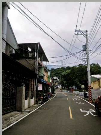
阿媽來自屏東縣來義鄉文樂部落。

中國父親、排灣母親，加上曾經長期在泰雅部落生活，錯綜交雜的身分經驗，讓阿媽在面對那幅巨大的地圖前，不知如何擺放自己身體的位置、觀看的視角。而《職貢圖卷》裡的山豬毛社女子所穿的那件「宮廷風」披肩，更完全顛覆了她對排灣族女性傳統服飾的認知——原來，「他者」是這樣看待「我們」的。