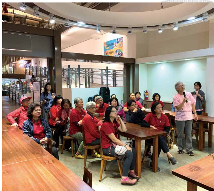
聽取臺灣工藝研究發展中心志工隊簡報。

工藝中心位於南投草屯，徜徉在一片綠意的森林之中，志工隊人數四百多人，經營的有聲有色，連簡報都是志工伙伴製作，更分攤了許多行政、文書、聯