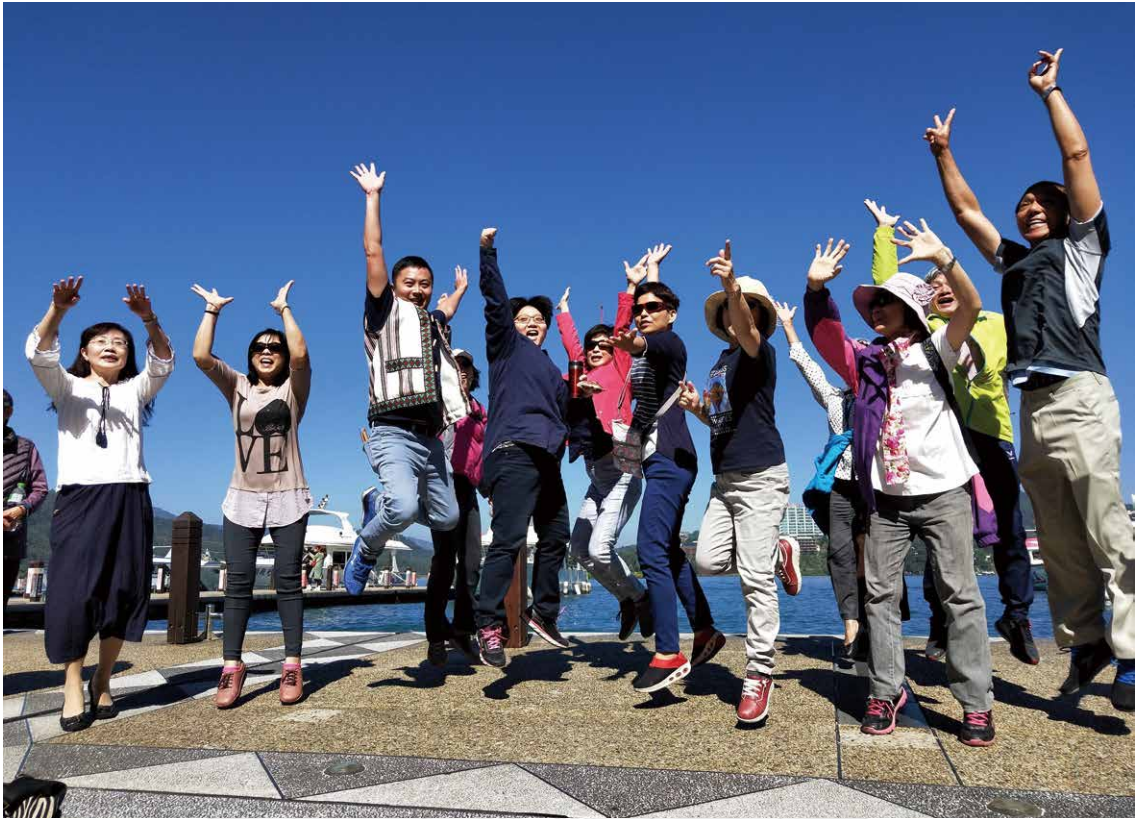
志工伙伴們的歡呼。

繫、關懷等工作。不少幹部更是在家作業，付出良多。在此次的觀摩中學習不少，許多做法也值得本館參考。