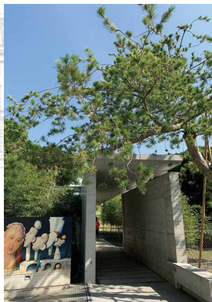
獲得建築獎項之毓繡美術館。