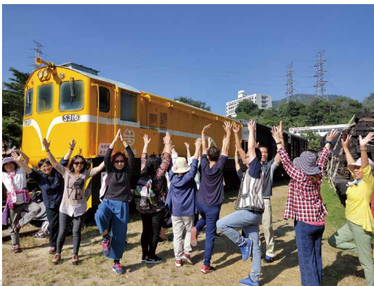
嗨！南投學習之旅遇見火車。

下午的另一個行程，是廣興紙寮的 DJY 拓印活動，在導覽人員帶領大家認識製紙的特殊植物和相關流程之後，志工伙伴们開始拓印，完成作品後，有幾位