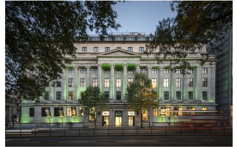
位在倫敦鬧區的 Wellcome Collection。

在什麼樣的博物館裡可以發現拿破崙的牙刷、斷頭台上的舊刀片和三百年歷史的人體義肢？從各個宗教裡的護身符、修士穿的鐵針鞋到手術台上的產鉗，幾乎所有關於身體、信仰、醫學的物件都可以在這裡一探究竟，那就是位在倫敦的惠康收藏館（Wellcome Collection），專注於跨學科的呈現，讓醫學、人文、科學、藝術交融在一起。