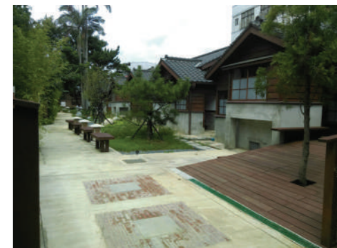
鍾肇政文學生活園區外觀，保留原日式宿舍建築群樣貌。

除了桃園，在臺南你也可以發現鍾老的足跡。鍾肇政不只創作精彩，也寫得一手好書法，「國立臺灣文學館」的牌匾即為鍾老所提，館內亦收藏其書法字，藉此也能看看作家不同的一面。