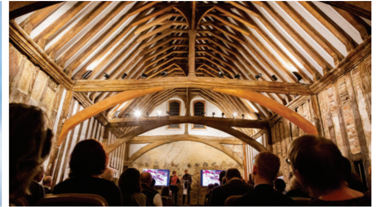
想在古堡裡頭工作嗎？英國國家寫作中心的「龍廳」就是你的選擇。

想像一下，獨自一人帶著書寫工具與簡單行囊，遠離平日生活瑣碎的例行事物、慣有的生活社交圈，毫無後顧之憂地來到一間特別準備的工作小屋，裡面不只有乾淨的書桌與床，也有可能即時送來的餐點。如果這樣的畫面深深吸引著你，也許可以考慮成為駐村作家。