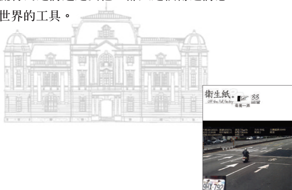
《衛生紙詩刊+》最後一期的封底。