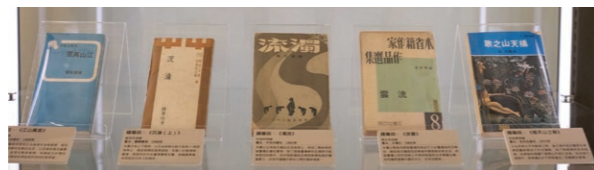
展出中的珍貴書籍。