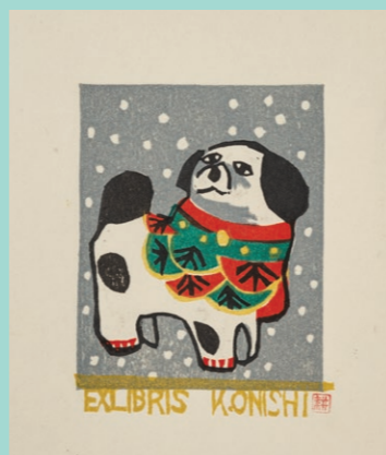
藏書票：左圖「貓臥書桌(左)」(創作者：王振泰)、右圖「戊(狗)」(創作者：大西耕三)。

你是否對臺文館神秘的庫房有許多想像？聽說，那裡毛毛的？別擔心，此毛非彼毛，沒有驚嚇，只有療癒！本館推出「友直友諒友多毛——阿貓阿狗的文學史」特展，邀請躲在庫房裡的毛孩，在文化部藝廊亮相，為你訴說一個個充滿溫度的文學故事。