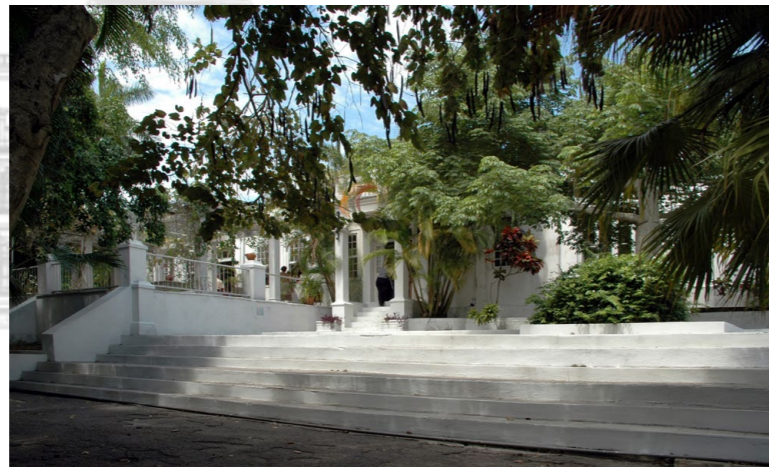
鬱鬱蔥蔥的瞭望莊園裡矗立著潔白的石灰岩別墅，就是作家海明威生前住過 21 年的地方。