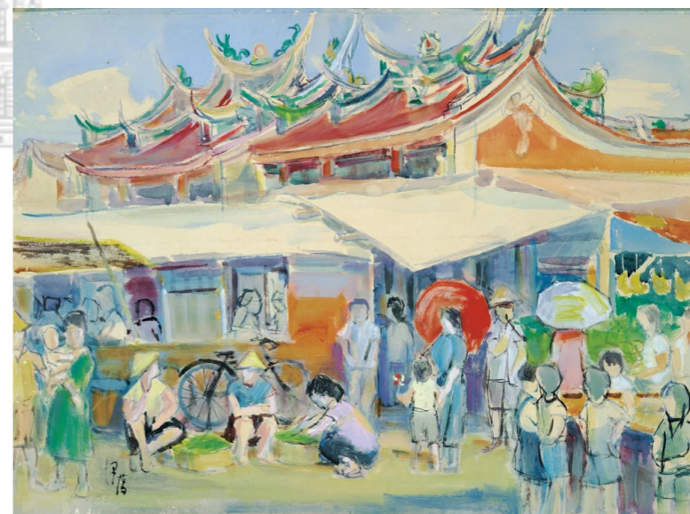
李澤藩《外媽祖宮廟前》，紙本水彩，56x75 公分，1949，李澤藩美術館藏。

李澤藩留下不少關於新竹的畫作，如古蹟、風景、產業，並致力培育英才。《外媽祖宮廟》描繪新竹北門街長和宮，若將畫作放大仔細觀看，綠、紅、紫、黃等多色巧妙融合於廟宇屋簷，在廟外棚子下有蹲著的菜販、肉販，撐傘婦人、拿風車小孩等，顯現炙熱陽光下，廟旁菜市場活力。曾經盛產香茅的新竹，李澤藩以《香茅油工廠》為筆下題材，透過兩幅畫作一窺新竹民間活力。